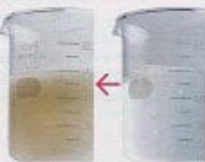
透明だったリジュベネーション・ウォーターが、施術後はこんなに白く濁ってドロドロに！

リンパマッサージに使用するアミノ酸ベースの水、リジュベネーション・ウォーター。皮膚から浸透して皮膚層まで届き、皮膚の中に溶け出した有害物質を老廃物として排出する役割を果たすといううちに、白く濁ってドロドロに変化。デトックスが目に見えてわかり「こんなに効果が高まっているの？！」と驚くはず