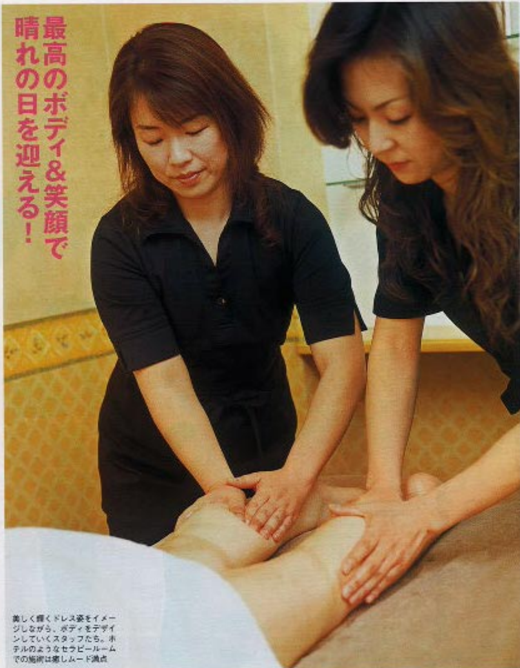
美しく細くドレス姿をイメージしながら、ボディをデザインしていくスタッフたち。ホテルのようなセレクトルームでの施術は癒しモード満点