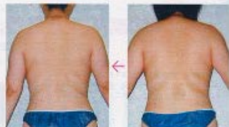
AFTER 首から肩、背中にかけてのラインがスッキリ！