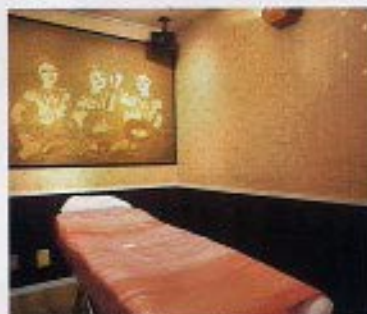
癒しモード溢れる個室での施術。サロン内は、繁 華街にあるとは思えないほど静か

両満としみさんによる、ゲルマニウムベ ッドでのヒーリングコース(活生水付き) ¥10,500