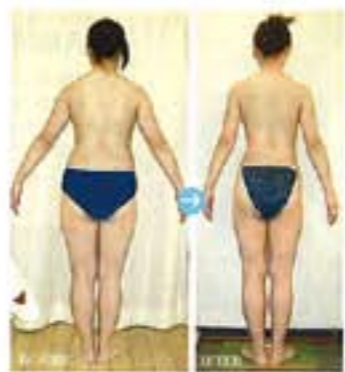
27歳、3か月でリジュ8回施術。体重-8kg、ヒップ-11cm、ウエスト-5.5cmのメリハリボディに。むくみも取れボディ全体の印象がスリキリ