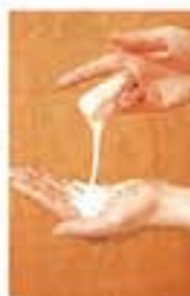
トロリとした天然の胎質成分が美肌へ導く「ゲル化粧品」はこちらのオリジナル。