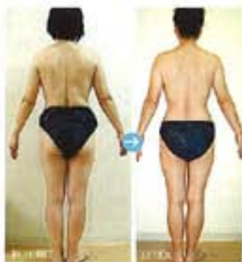
43歳、1か月でリジュ5回施術。体重-2kg、ヒップ-9cm、下腹圍-13cm。作業よりも見た目に変化が表れるのは、体から変化している証拠