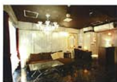
パカラの照明など、インテリアにもこだわった空間は「本物の美」がテーマ。「くつろぎながら平日を頑張った疲れを、シックなポップな遊びを、気分を盛り上げて