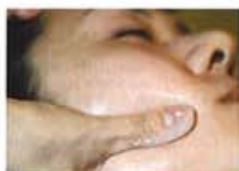
新選り美肌を目指す「フェイスコース」は、ゲルマニウムやマッサージでむくみや老廃物を出し、輪郭も調整。ひざ下デトックスマッサージ付き