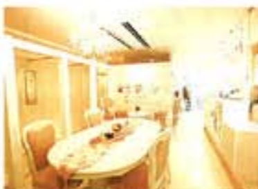
店名でもある、天使のオブジェや白いペンキと白き茶園にロマンチックな雰囲気のサロン。施術はプライバシーを考慮した個室なのもうれしい。