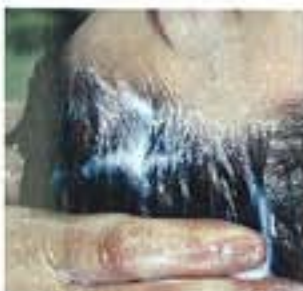
頭皮専用ジェルでマッサージすると、シャンプーしない量の老廃物が！ 試す価値あり。