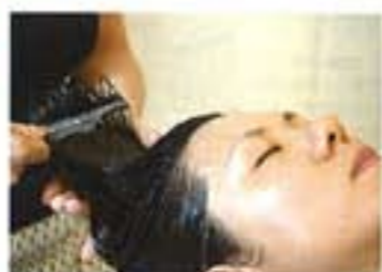
「頭皮・毛髪活性化スカルプコース」は皮脂腺が活性化されることでヘアロビ2時間以上分の汗が、全身中、首のリンパマッサージ、その後ストレッチを