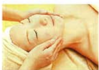
「若返りプログラム」は、ドクターズコスメで肌の奥まで働きかけ、古い角質を押し上げることで新しい肌質をつくるというもの。ニキビや敏感肌にも安心