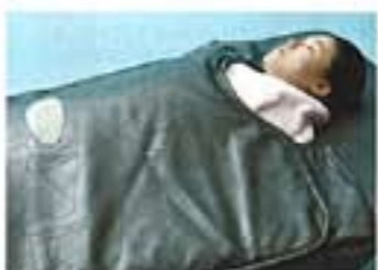
「デトックス発汗ゲルマニウムベッド」は40分程度になるだけでエアロビ2時間以上分の汗が、全身中、首のリンパマッサージ、その後ストレッチを