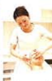
オリジナルメソッドの「アンチエイジング」は1回でも効果を実感できる。