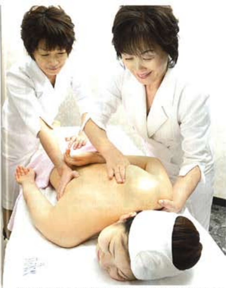
ゲルマニウムベッド、ストレッチの後、2人の技師がつかみどりで行うリンパドレックスマッサージ。その後さらに美容整形まで受けられる

今はエステサロンが多くなつた19年前、一専店の理容店からスタートした「エステ・ステーション」。10年以上のキャリアを持つスタッフが約4割、各店長の平均キャリアも12年という技術者ぞろいのサロン。母体としての利用もあるなど、その実績に厚い信頼が寄せられている。オリコンランキンング「顧客満足度調査」では総合部門で全国2位、豊後店でも5位を獲得し、今や業界以外からも注目されるサロンに。 「高度なテクニックが必要とされるリジュを敢り入れるのも早く、現在4店舗で導入済み。利用者から「この効果のすごさ、素晴らしい」との声も多く、今回はリジュ導入の4サロンで特別体験キャンペーンを開催。ボディやフェイシャル、スカルプなど4つのリジュコースが通常の半額に。お悩みの機会に、ぜひその実力を体験してみてください。