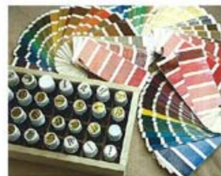
最大限に魅力を引き出す色やメイクのコツを伝授する「パーソナルプロデュース」やアロマで効果的に価格設定する「貴族アロマコース」も

サロン併用のリジュでは上質のハンドテクで即座にシェイプできるのがうれしい。30代の女性がたった5回でこのサイズダウンを再現！