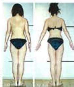
リジュ1回でこの結果！背中や下半身のむくみがスッキリして、ウエストも引き締まったのがわかる(35歳)。

肌老化・無添加化粧品で知られる「アジュバ化粧品」の取り扱いもしているサロン。心と体に優しいサロンならではの。